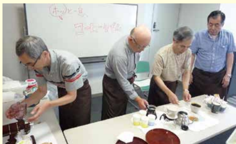
おいしいコーヒーになるよう愛情もそそぎます

vol.2 男性グループが活躍「ホッと一息、コーヒータイム」 ☎ 西区社会福祉協議会 ☎ 450-5005