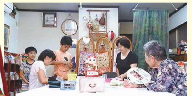
誰もが笑顔になるステキな場所

vol.2 男性グループが活躍「ホッと一息、コーヒータイム」 ☎ 西区社会福祉協議会 ☎ 450-5005