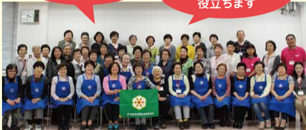
西区ヘルスマイトの皆さん