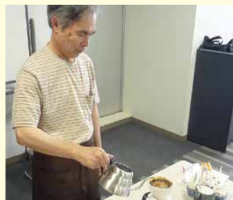
グループのメンバーみんながマスターです

昨年度に西区社会福祉協議会で行った「おもてなしのコーヒー講座」の修了生有志が「ホッと一息、コーヒータイム」というグループとして5月から活動しています。現在は、親子ふれあいサロンなどの地域の中のさまざまな場面に出張し、おいしいコーヒーをお出ししています。豆を挽くところから淹れる本格派で、グループ名通り「ホッと」した憩いのひとときを提供しています。「大好きなコーヒーで皆さんに喜んでもらえるのがとても嬉しい。どんどん依頼してほしい」と、渋いマスターたちは活動に向け意欲的です。ご依頼は、西区社会福祉協議会へ!