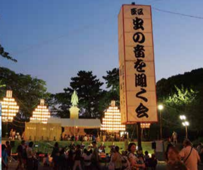
多くの人出でにぎわいます