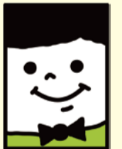
西区社会福祉協議会キャラクター ニシ・ニコ・マッチ氏

vol.1 駄菓子屋をみんなが集うカフェに! ☎ 紅梅気楽カフェ(戸部本町17-5) ☎ 412-6559 営業時間: 10時~14時(年中無休)